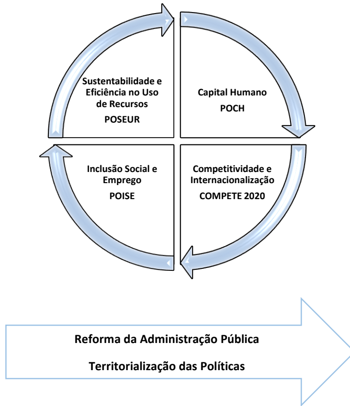
Figura 1. Estrutura Operacional Portugal 2020